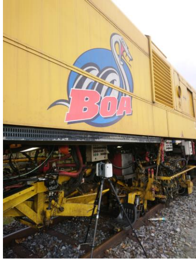
Figure 2: Acquisition des machines