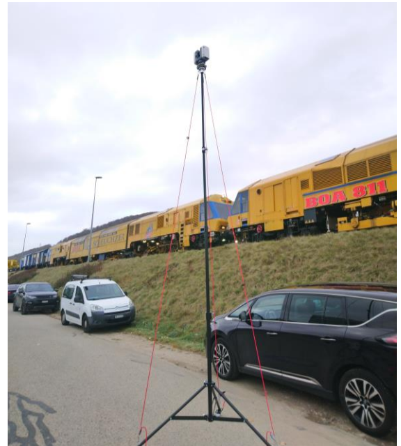
Figure 1: Scanner sur trépied de 5m