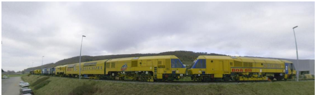
Figure 4: Portion d'une image 360° du RTC360